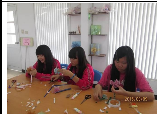
商業經營職群學生實作產品包裝