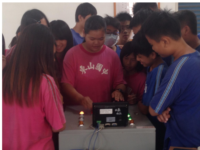
1031027 參訪鄰近白河商工，讓同學了解社區高中的課程、科別及設備。