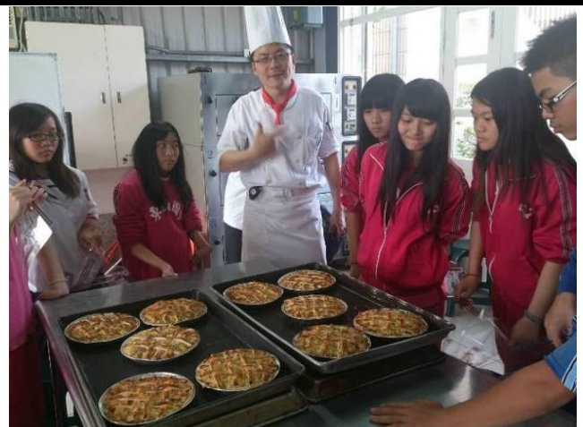
餐旅職群學生實作 pizza