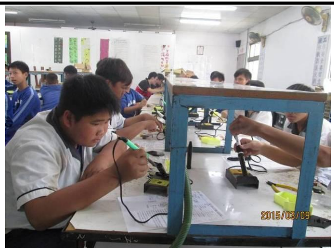
電機電子職群實作電子鳥