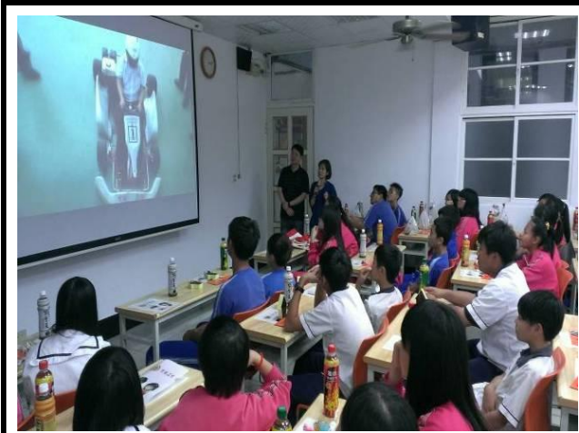
1040309 八年級全體學生參加實作體驗營，合作高職進行簡介