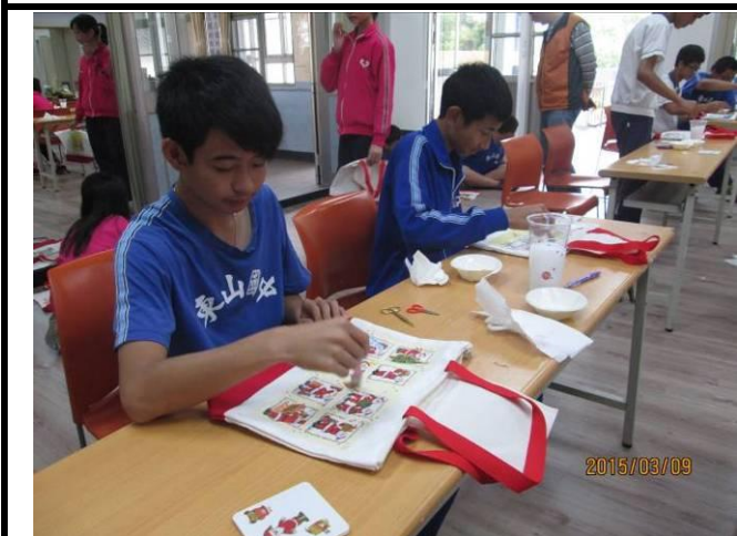
家政職群學生實作蝶古巴特